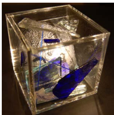
"Costellazione portatile", vetro, colla animale, nerofumo, plexiglass, 10 x 10 x 10 cm, 2014

La mostra è visitabile il martedì dalle 10.00 alle 13.00 e dal mercoledì al sabato dalle 16.00 alle 19.00. Altri giorni e orari su appuntamento. INFO: www.zoiagallery.com | info@zoiagallery.com | tel. 349 1509 008