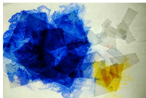
"Carte", collage, gomma arabica, 25 x 38 cm, 2015